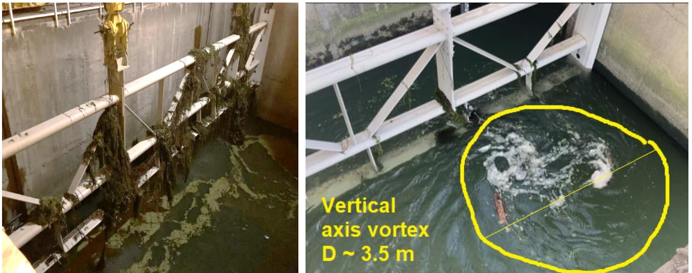
Slika 1. Levo) Rečna vegetacija upetljena na merni ram; Desno) Vrtlog na desnoj strani ulaza u turbinu A7

Zarad konciznosti i razumevanja komponenata merne nesigurnosti, ključne specifične karakteristike metode merenja protoka na HE Đerdap 2 bi trebalo naglasiti pre samog opisa procedure za procenu merne nesigurnosti: