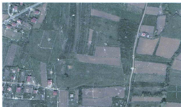
Слика 2. - Село Велика Моштаница – ортофото и катастарски план

Следећи корак била је процена ситуације у заједници. То подразумева процену потреба и могућности потенцијалних учесника у комасацији, као и процену социјалних, економских и еколошких могућности и ограничења за комасацију пилот подручја. У овој фази нарочито је било битно проценти стање постојећих катастарски података за Велику Моштаницу. Закључак је да су планови и алфанумерички подаци неажурни и нетачни. Ово се посебно односи на резиденцијални део, док је ситуација на пољопривредним подручјима нешто боља али ипак не задовољавајућа (слика 2).