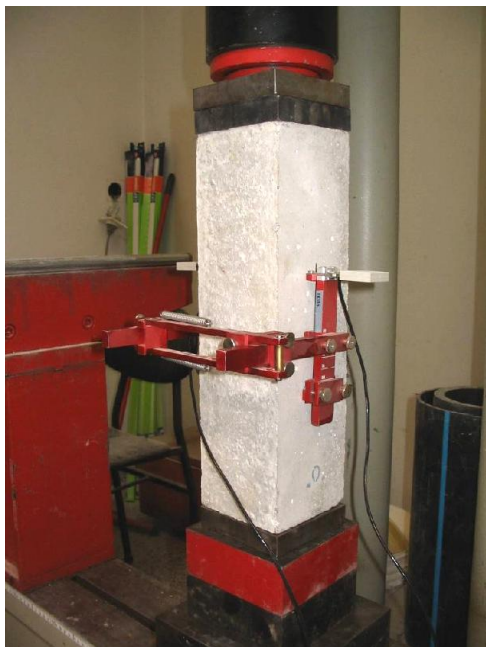
Слика 1. Диспозиција испитивања статичког модула еластичности

Укупно је испитано по три узорка од сваке серије, тј. 3 \times 7 = 21 узорак.