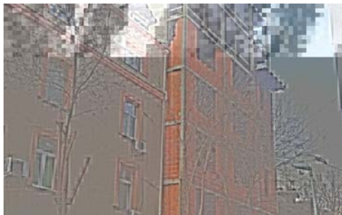
Slika 3. Hotel na Dorćolu i objekat u Sindelićevoj

Veoma izražena pojava „investitorskog urbanizma“, gde i pored dobijene građevinske dozvole investitori grade po slobodnoj volji, u poslednje vreme je veoma intenzivirano. Investitori svesno ulaze u ove poduhvate i pokazuju „veću snagu“ od zvaničnih državnih institucija. Odgovor javnosti i društva je jedino kroz snagu svesnih građana, kao što su: Građanske inicijative i formiranje društava za zaštitu i očuvanje graditeljskog nasleđa. Ovo je direktan odgovor na slabost ili nemoć institucija, što govori da veću „snagu“ imaju pojedinačni investitori od državnih institucija.