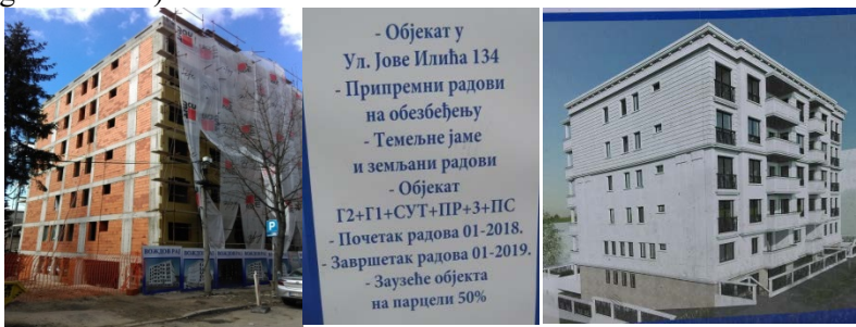
Slika 2. Objekat u Jove Ilića - izgrađena dva sprata više od dozvole

6. Adaptacije, rekonstrukcije, prepravke objekata ili njihovih delova a koji se iz formalnih razloga ne mogu podvesti pod investiciono održavanje ili aktuelne forme za koje nije (bila) potrebna procedura izdavanja (građevinske) dozvole.