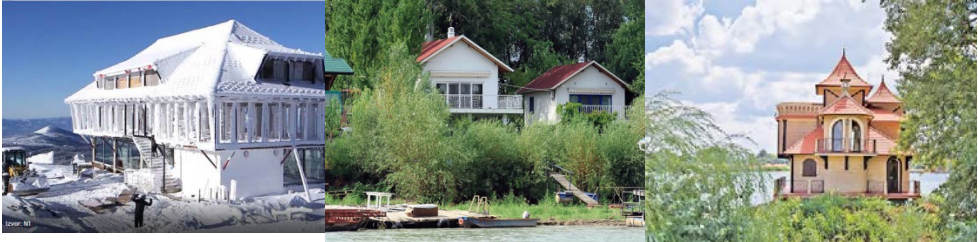
Slika 1. Nelegalni objekat u zaštićenim zonama (Kopaonik, unutar Savskog nasipa)

2. Objekti koji se zidaju bez dozvole i čijim se građenjem ugrožava tuđa, zajednička ili javna imovina (tavani i druge zajedničke prostorije).