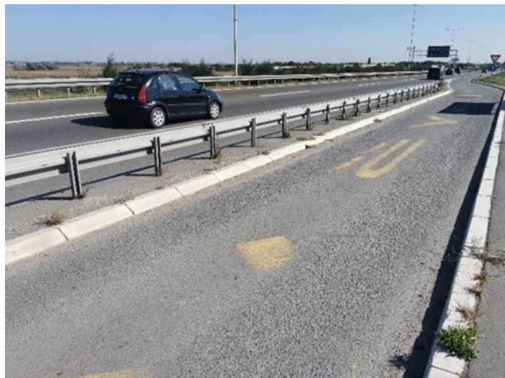
Slika 5. Problematična trajektorija uliva u osnovni tok autoputa (Izvor: [4])

Sve prethodno navedeno jasno signalizira da neadekvatno rešena kontrola pristupa može rezultira značajnim konfliktima u saobraćaju i narušavanjem bezbednosti po sve kategorije učesnika.