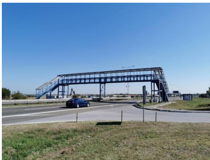
Slika 4. Mikrolokacija samog priključka

S obzirom da se na predmetnom delu pored priključka u nivou nalazi i autobusko stajalište brzina kretanja vozila na glavnom pravcu, zajedno sa dužinom i širinom ulivno/izlivnih traka ne omogućava bezbedno kretanje vozila u samoj zoni priključka, i to za sve kategorije učesnika u saobraćaju.