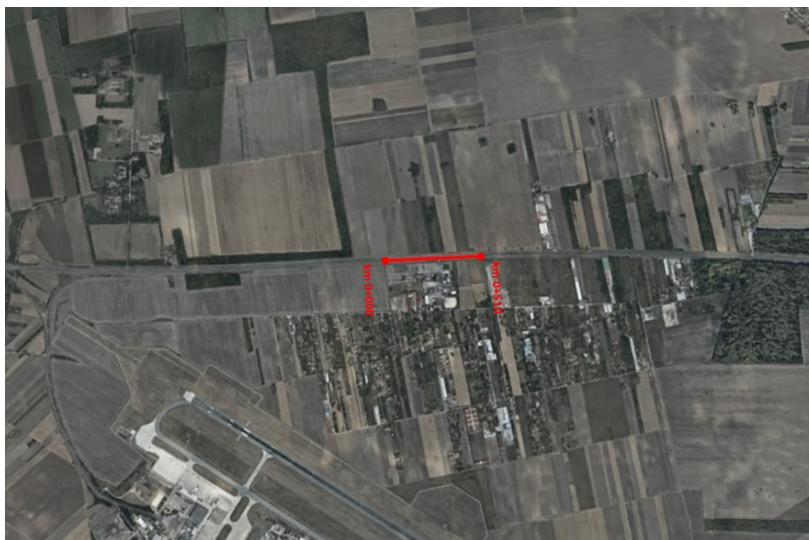
Slika 2. Mikrolokacija predmetne deonice

Prema Referentnom sistemu državnih puteva I i II reda, analizirana deonica spada u rang državnog puta IA reda, broj A1, deonica 1201 petlja Beograd - petlja Bujanj Potok (Leštane). Ukupna dužina deonice iznosi 29,5 km. Predmet provere bezbednosti saobraćaja koja je sprovedena oktobra meseca 2021.g. bila je deonica 1021 od 0+000 km do 0+510 km, u dužini 0,51 kilometra, Provera je sprovedena u okviru programa obuke stručnog osposobljavanja za revizora/proveravača bezbednosti saobraćaja.