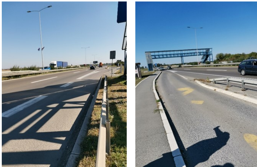
Slika 5. Konflikt ulivna traka/niša za zaustavljanje vozila (Izvor:[4])

Potom, kao naročito opasan detalj po bezbednost saobraćaja se izdvaja formiranje konfliktne zone u delu ulivne trake sa priključka na autoput i formiranje autobuske niše.