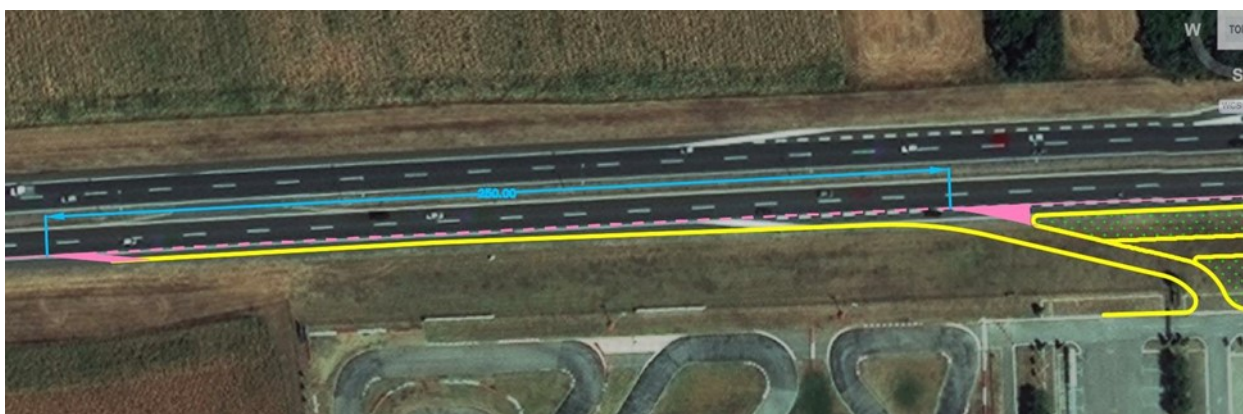
Slika 8. Formiranje ulivno/izlivnih traka dužine 250m