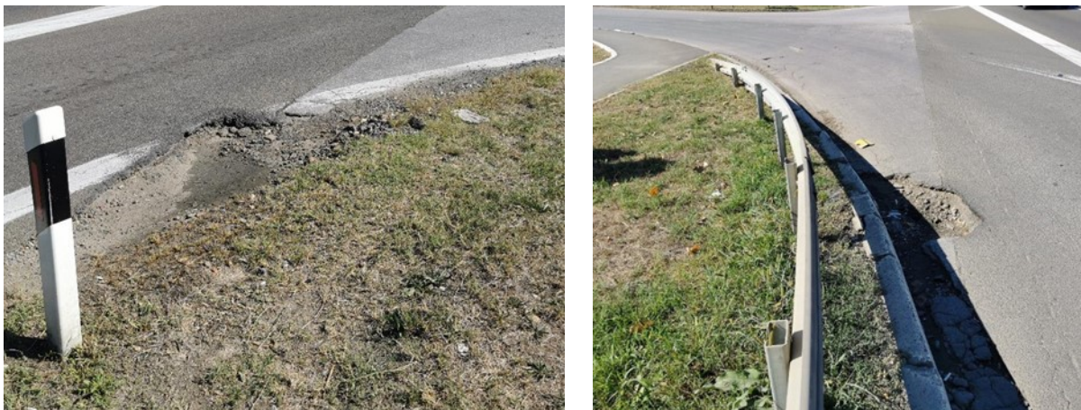
Slika 9. Oštećenje kolovoza usled neadekvatnog odvodnjavanja u zoni priključka

u odnosu na poprečni pad kolovoza autoputa. Ovakvo nivelaciono uklapanje priključka uzrokuje pojavu najnižeg mesta na kolovozu baš u zoni samog priključka, što je rezultiralo i oštećenjem kolovoza na tom mestu.