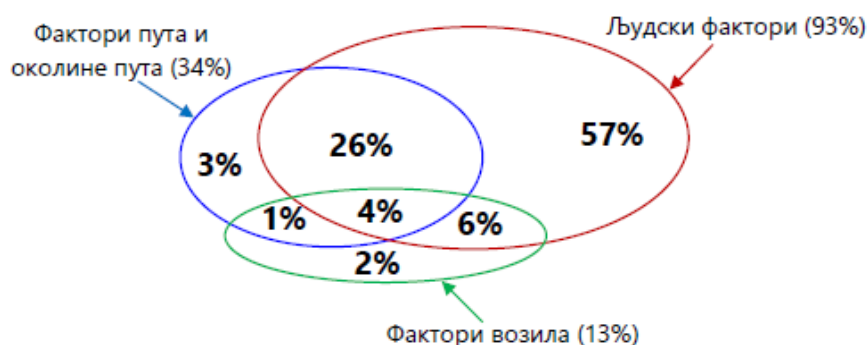
Slika 1. Uticajni faktori koji doprinose nastanku saobraćajne nezgode na putevima (Izvor: [2])

Tako su po PIARC-u (2003.g.) izdvojeni sledeći odnosi između uticajnih faktora na bezbednost saobraćaja kao dominantni: