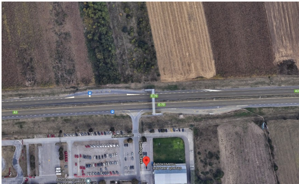
Slika 3. Mikrolokacija samog priključka

Osnovni problem predmetne deonice, koji za posledicu može imati veliki broj saobraćajnih nezgoda jeste saobraćajni priključak koji se nalazi sa desne strane kolovoza na stacionaži 0+230 km. Saobraćajni priključak je u nivou, suprotno pravilim struke kao i važećoj regulative, čime se ozbiljno narušava osnovna funkcija autoputa.