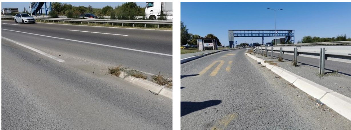
Slika 10. Nanošenje materijala u zoni razdelnog ostrva autobusnog stajališta

U obilasku terena konstantovano je da je poprečni pad autobusnog stajališta suprotno usmeren u odnosu na poprečni pad kolovoza autoputa. Takvo nivelaciono uklapanje uzrokuje pojavu najnižeg mesta na kolovozu, kao i zadržavanje vode u zoni baš između kolovoza autoputa i autobusnog stajališta. Tako se zadržavanje vode javlja i uz ivičnjak razdelnog ostrva. Samim tim, u ovim zonama dolazi i do nanošenja materijala koji se sakuplja zbog neadekvatnog odvodnjavanja.