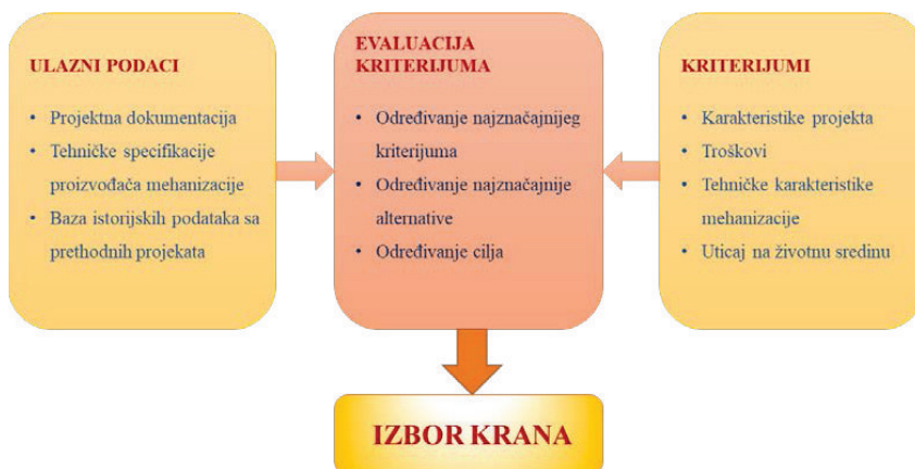
Slika 1: Predložena metodologija

Na Slici 1 dat je šematski prikaz predložene metodologije.