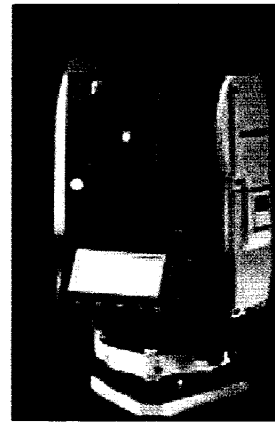
Слика 3.6.1. - Геодетска опрема из асортимана SOKKIA

Као илустрација, пројектовано предузеће је из асортимана дистрибутера одабрало тоталну станицу SOKKIA SET610 , чија цена пакета износи 426.000,00 дин., са следећим условима плаћања: