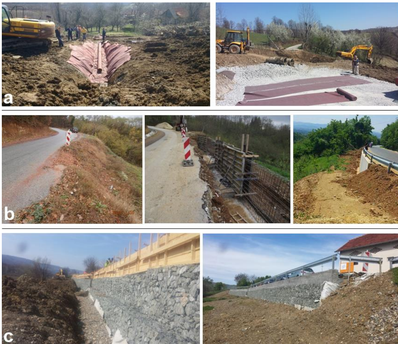
Slika 2. Radovi na sanacijama klizišta u 2017. a) Klizište Gonja Crnuća - drenažni radovi; b) Klizište na putu Toponica-Sumorovac - potporni zid; c) Klizište Levići – gabionska konstrukcija

rokovima i da budu završeni do početka juna, dok za sanaciju klizišta u Boljevcu treba da se raspiše javna nabavka. Na Slikama 2 i 3. su prikazani primeri sanacije 4 klizišta u 2017. sa izgledom u više faza tokom izvođenja radova. Za sada nije poznato da li će se dinamika saniranja netabilnih terena na putevima Srbije nastaviti istim tempom kao što je bila u prošloj godini.