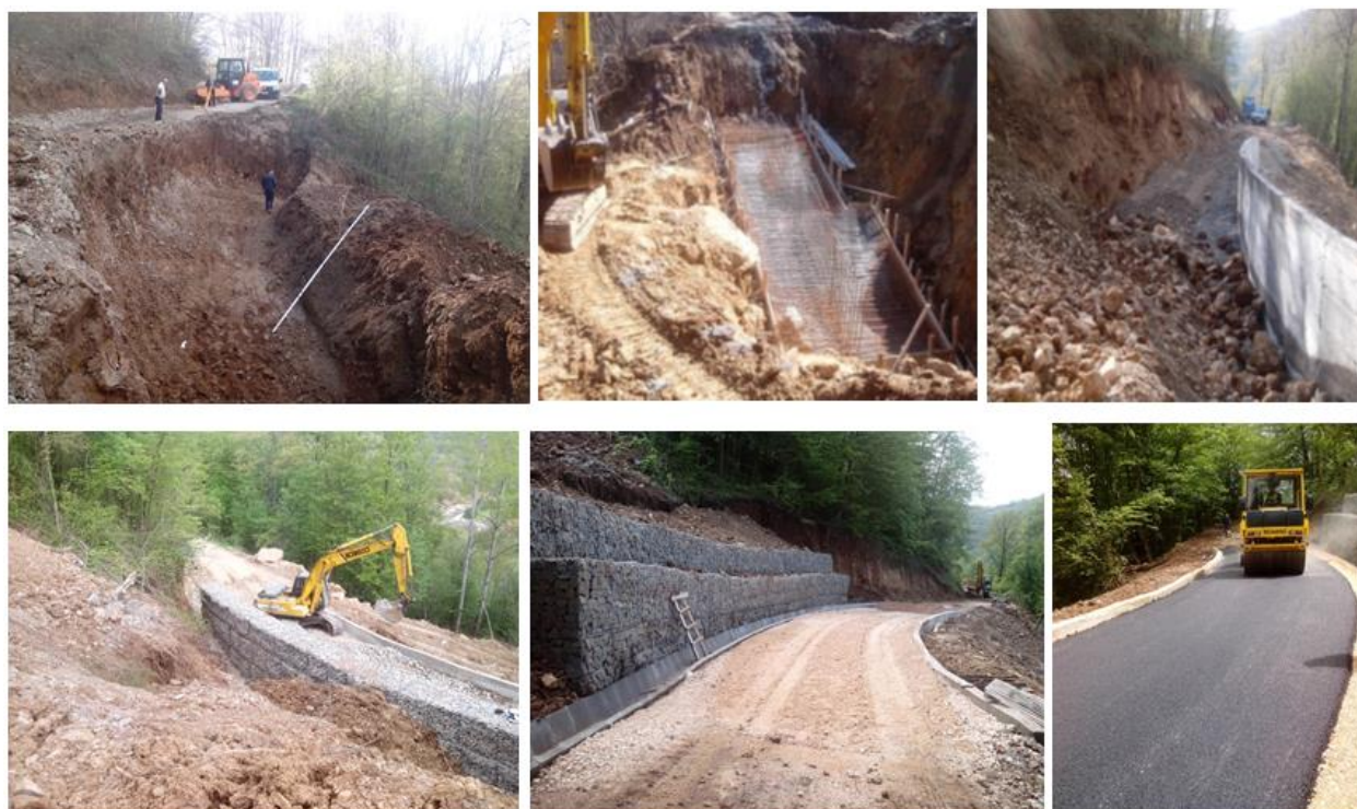
Slika 3. Radovi na sanacijama klizišta u 2017. Klizište na nekategorisanom putu Ljuberađa - Berduj (opština Babušnica) - potporni zid i gabionska konstrukcija

Preovlađuju površine kliznog tela između 0.2 ha i 1.5 ha (prosečno oko 0.5 ha) izuzev klizišta u Ribarima, u Krupnju (zaseok Troska) i na putu Kraljevo - Raška u mestu Pivnice, koji su površina preko 3 ha.