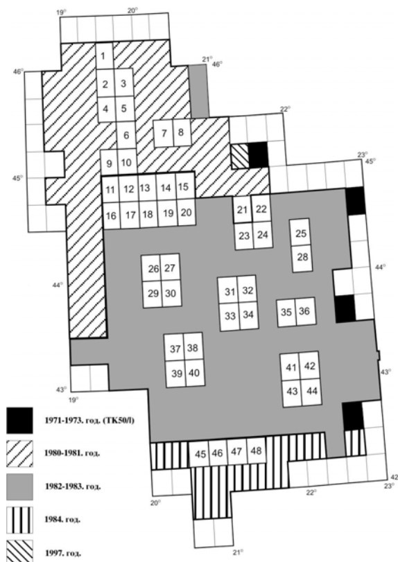
Slika 2 – Analizirani listovi i periodi izrade

Ovo ocenjivanje je sprovedeno za uzorak od 48 listova DTK50 (oko 25%). Listovi su birani tako da obuhvate tri karakteristične epohe rada na TK50/II i da istovremeno njihov raspored na državnoj teritoriji bude što ravnomerniji (slika 2).