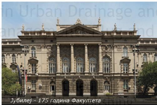
Јубилеј - 175 година Факултета

У земљама са тако бурном историјом као што је има Србија одувек је било тешко градити и оснивати, још теже опстати, а најтеже – трајати. Високошколска настава из области грађевинарства и геодезије, нераскидиво повезана са Грађевинским факултетом у Београду, траје већ 175 година. Чувена Инџинирска школа, основана 1846. године при Лицеју у Београду, наш је истински камен темељац, претеча, високошколска и образовна институција из које је изникла Грађевински факултет Универзитета у Београду. Следили су је Техничко одјеленије наука при Лицеју (1853-1863), Технички факултет при Великој школи (1863-1905) и Технички факултет при Универзитету у