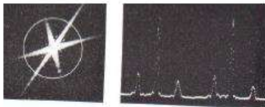
Слика 2. Спектар снаге: циркуларни и сигнатура P_0

Кључне речи: Корелационе функције, момент / кумулантни методи, статистичке опсервације