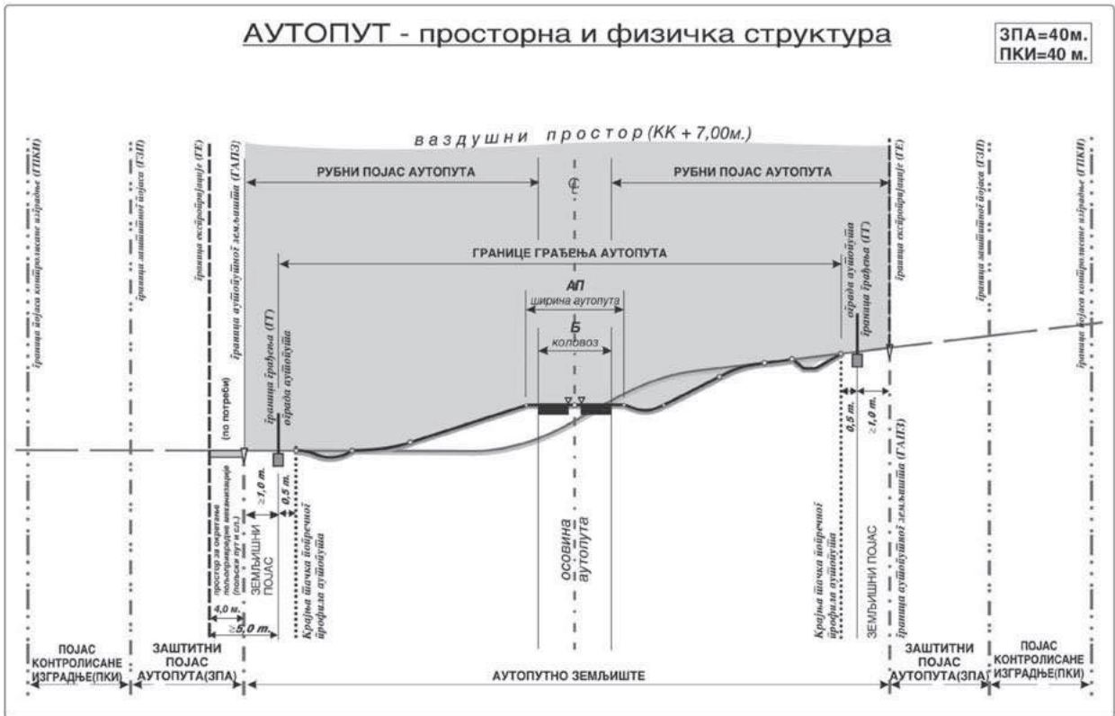
Slika 2. Prostorna i fizička struktura autoputa

Kako bi projektant mogao sa sigurnošću da tvrdi da je položaj trase u sve 3 projekcije optimalan, podrazumeva se da je ceo set inženjersko-geoloških i geotehničkih istraživanja već završen, zajedno sa geodetskim snimanjem terena. Sve ove aktivnosti su, u izuzetno kratkim rokovima izrade tehničke dokumentacije koji su propisani tenderskim procedurama, gotovo nemoguće. Takođe, s obzirom da se na osnovu PPPPN vrši eksproprijacija zemljišta u tom planu se prikazuje samo jedna varijanta trase do koje se došlo prethodnim aktivnostima.