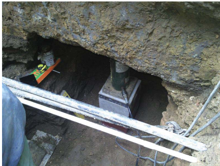
Slika 5. Utiskivanje betonskih prefabrikovanih elemenata "MEGA" šipova