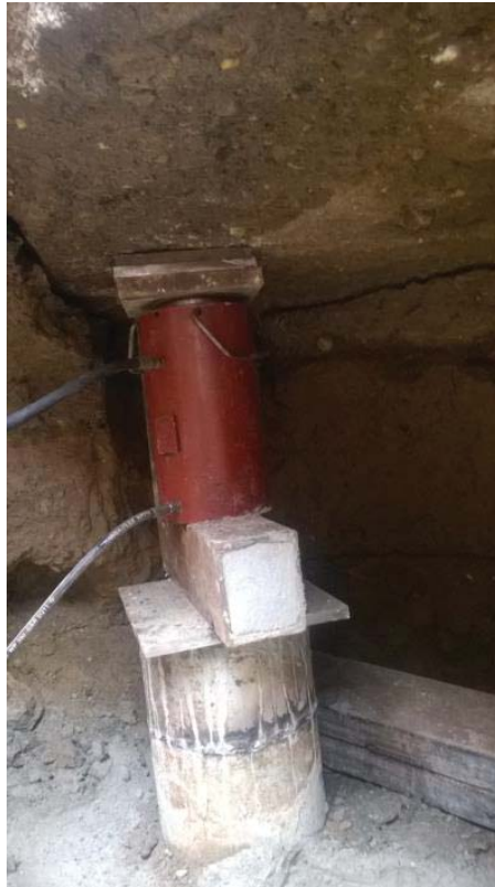
Slika 4. Utiskivanje čeličnih cevi kao elemenata "MEGA" šipova [3]

obezbeđenje od zarušavanja. Dimenzije iskopa treba da su što manje, a da omogućuju nesmetane uslove rada.